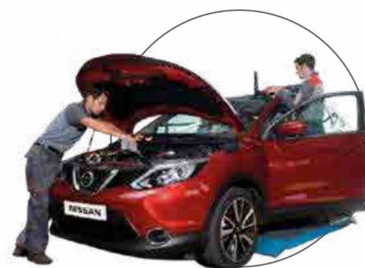
REVISIÓN DE 27 PUNTOS DE SEGURIDAD