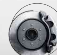
LIMPIEZA Y AJUSTE DE FRENOS