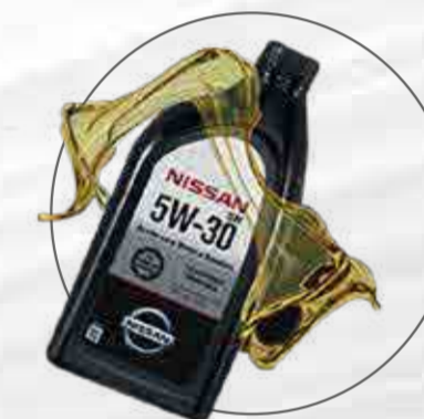
CAMBIO DE ACEITE MINERAL