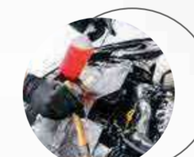
LIMPIEZA INTERNA DE MOTOR