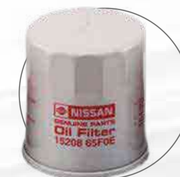
FILTRO DE ACEITE