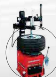
ALINEACIÓN Y BALANCEO