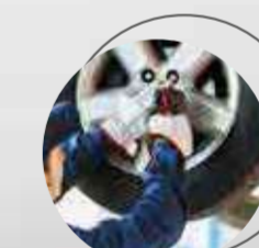
ROTACIÓN DE NEUMÁTICOS