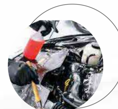
LAVADO DE MOTOR, CARROCERÍA Y ASPIRADO