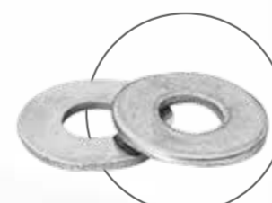
CAMBIO DE ARANDELA