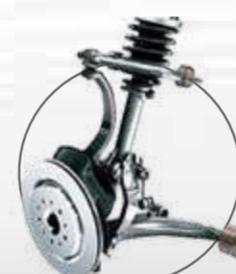
REAPRIETE DE SUSPENSIÓN